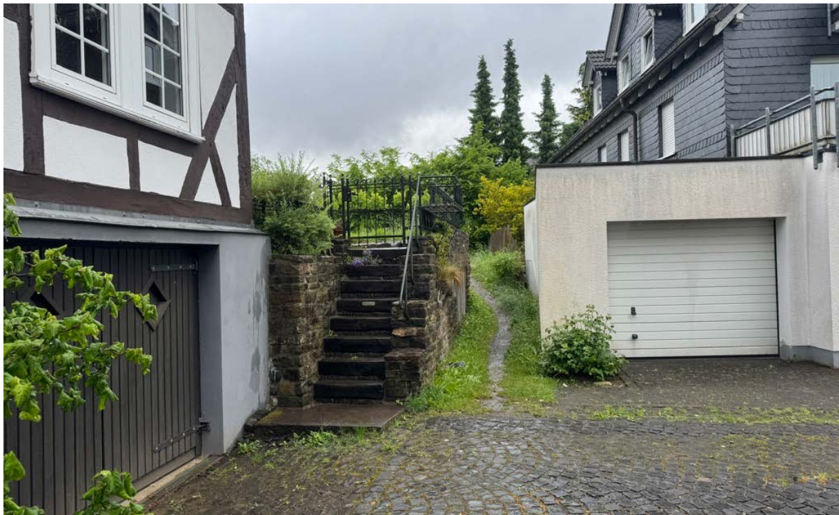
Abbildung 11: Trampelpfade als Hinweis auf wichtige Wegeverbindungen