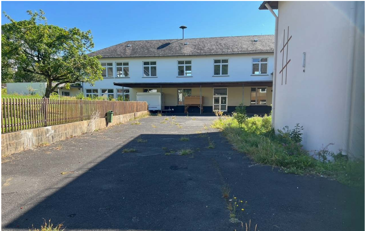
Abbildung 8: Versiegelter Schulhofbereich (1)