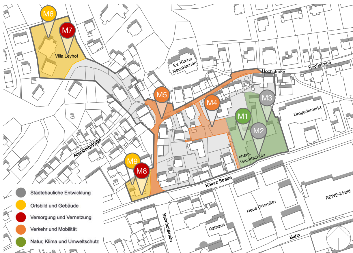
Abbildung 4: Maßnahmengbiet Ortsmitte in Neunkirchen mit Verortung von Maßnahmen

Nachfolgend erfolgt nun die Beschreibung der geplanten Maßnahmen in Form von Maßnahmensteckbriefen.