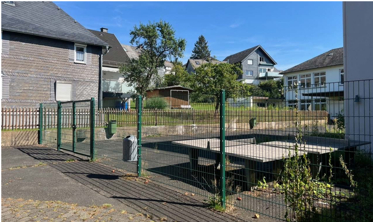
Abbildung 9: Versiegelter Schulhofbereich (2)