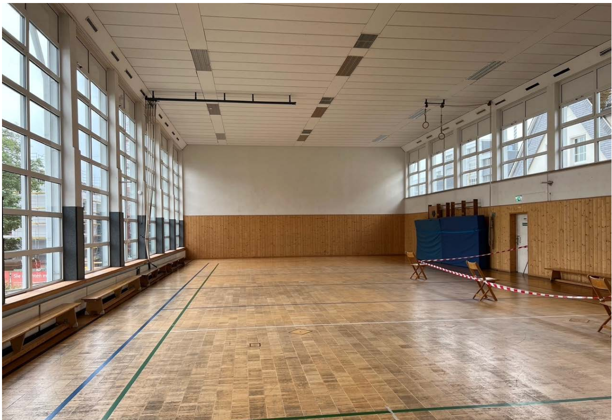
Abbildung 7: Blick in die Grundschulsporthalle