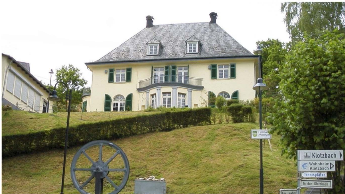
Abbildung 13: Villa Leyhof in Neunkirchen