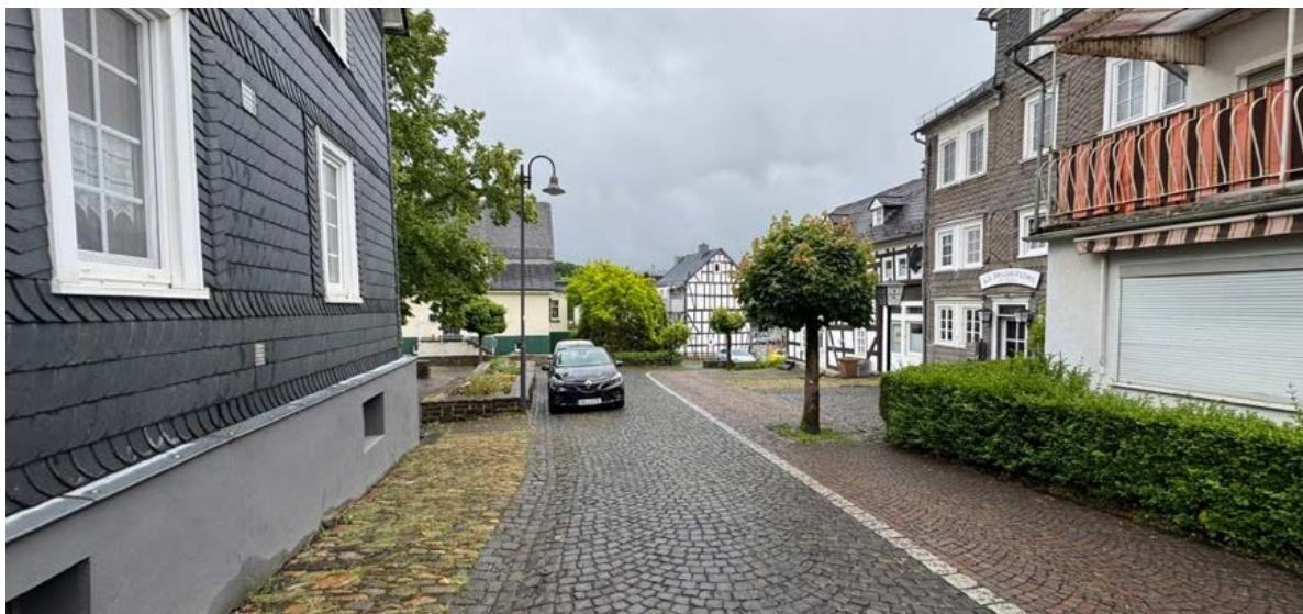
Abbildung 12: Blick in den Straßenraum in der historischen Ortsmitte