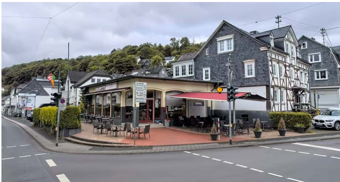
Abbildung 14: Gebäude Kirchstraße 1 Kreuzungsbereich Kölner Straße/Kirchstraße