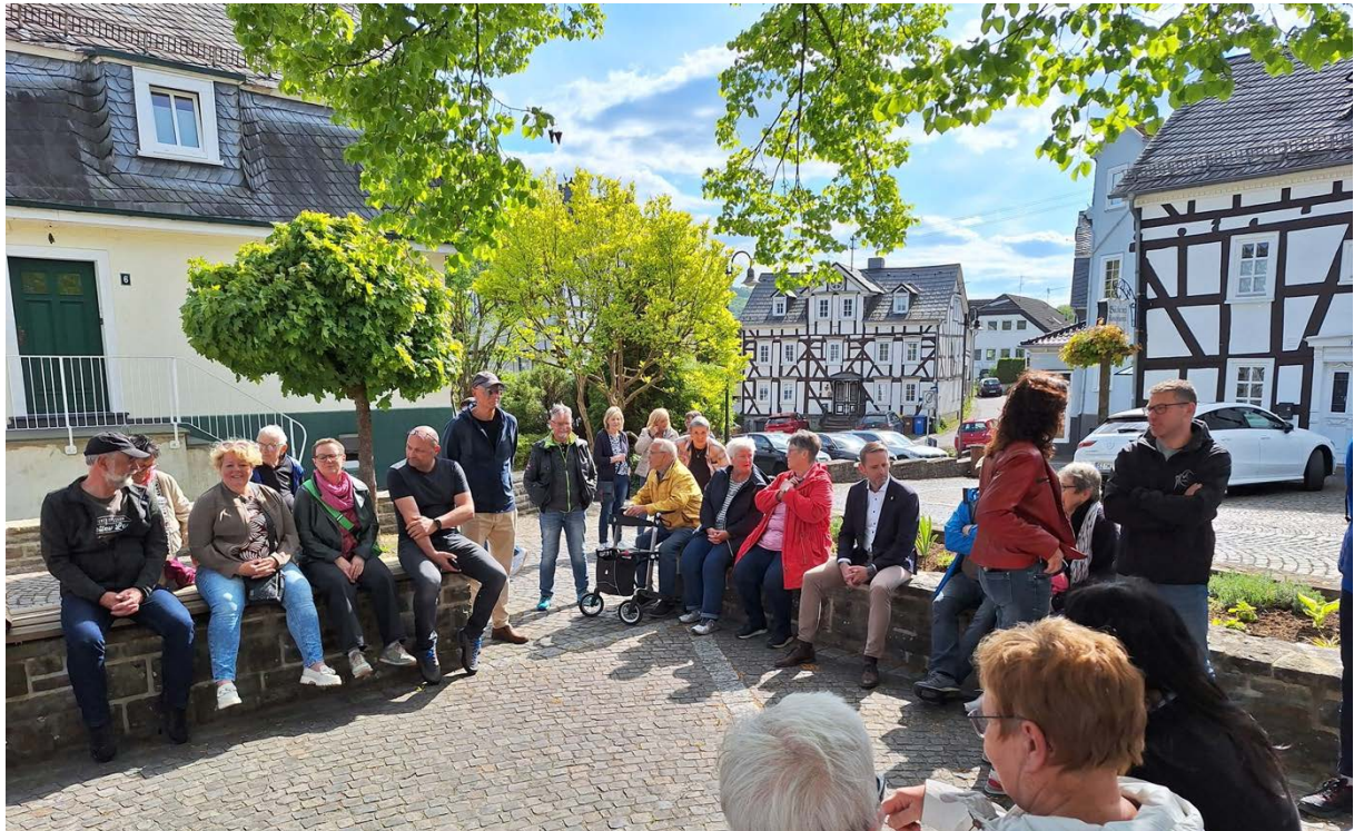
Abbildung 1: Bürgerbeteiligung zur Entwicklung der Ortsmitte am 08. Mai 2025.

Radwegeverbindungen gesammelt sowie zu Möglichkeiten der Klimafolgenanpassung direkt vor Ort eingebracht. Die Gemeinde hat gemeinsam mit Bürgerinnen und Bürger der Ortsmitte Ideen und auch konkrete Maßnahmen erarbeitet, die in das hier vorliegende Teil-ISEK 1 einfließen.