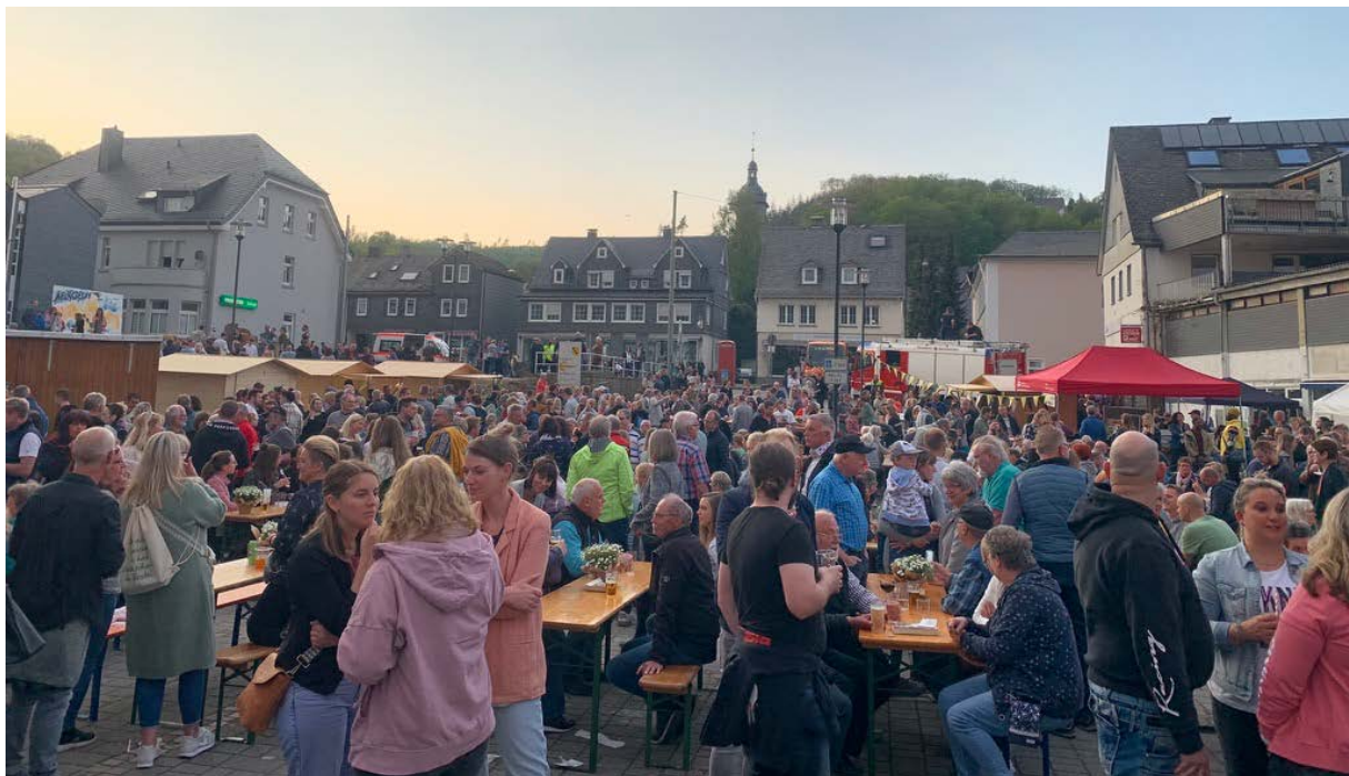
Abbildung 16: Öffentlichkeitsarbeit. Beispiel der Abrissparty im Mai 2022 als Auftakt zur großen Baumaßnahme "Rathaus-Quartier"

11.1. Ausgaben für die Steuerung und den Abschluss von Erneuerungsmaßnahmen