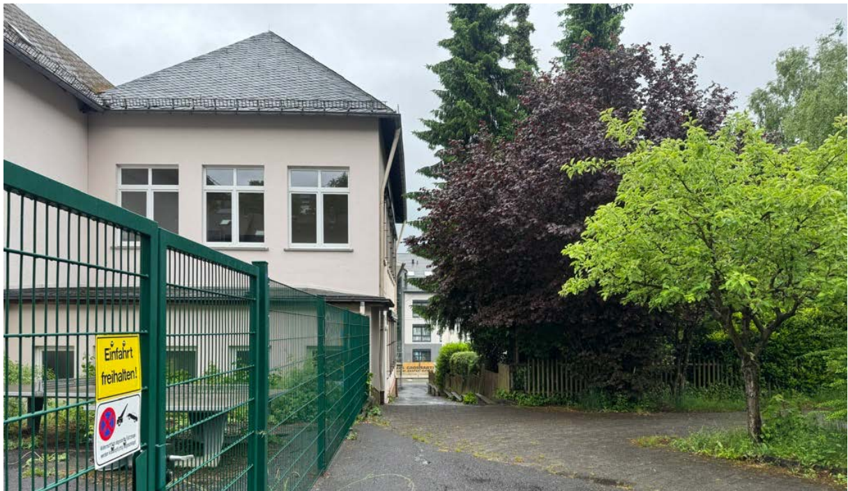
Abbildung 10: Wichtige Fußwegeverbindung zwischen Kölner Straße und historischer Ortsmitte entlang ehem. Grundschule