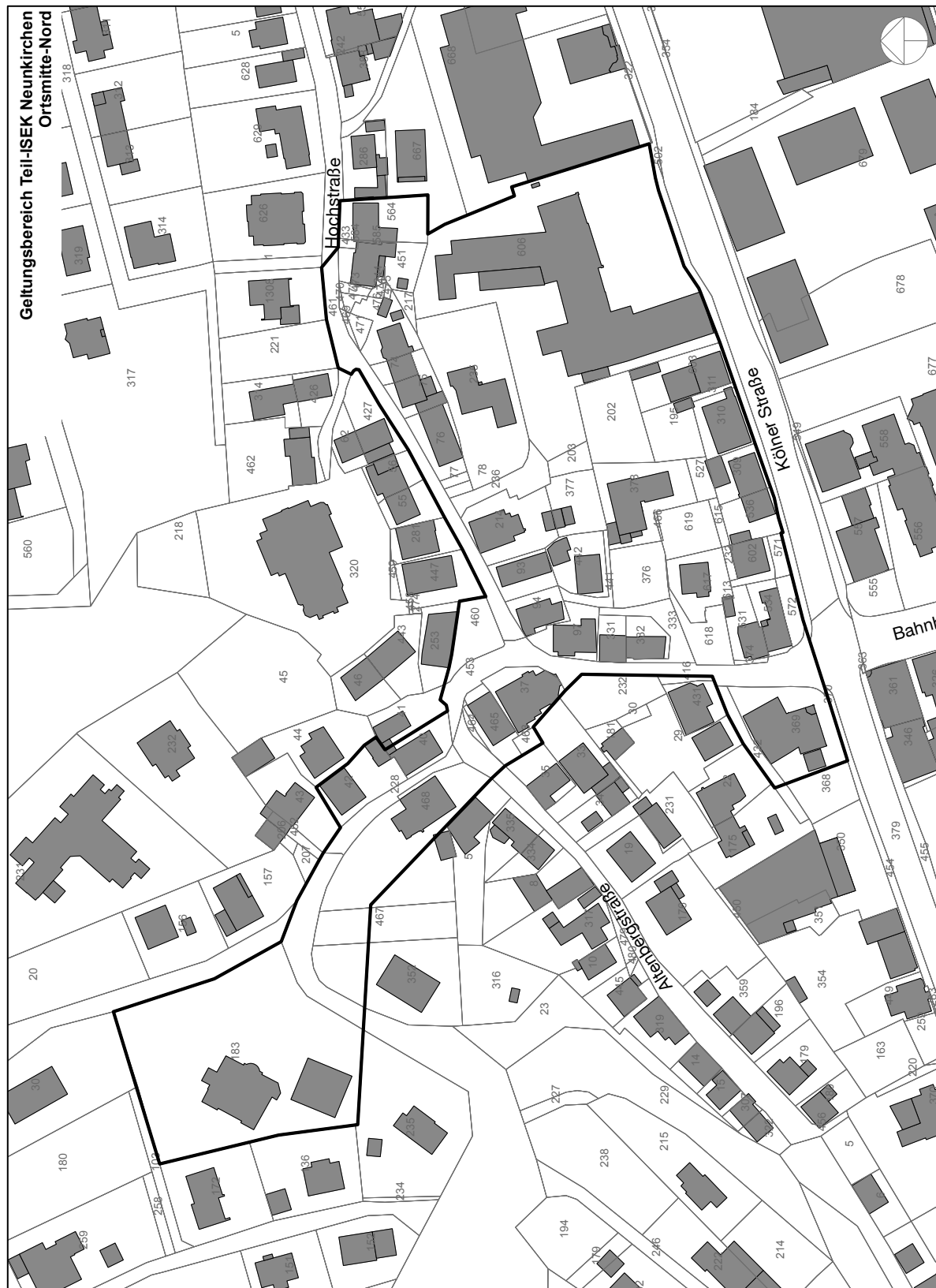
Abbildung 2: Gebietsabgrenzung Stadtumbaugebiet gem. § 171b BauGB

Für das Teil-ISEK 1 „Ortmitte Nord“ der Gemeinde Neunkirchen wird eine Gebietsabgrenzung vorgenommen, die entsprechend § 171b BauGB das ca. 2 ha große Gebiet als Stadtumbaugebiet festlegt.