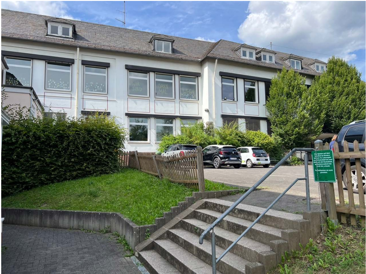
Abbildung 6: Grundschulgebäude in der Ortsmitte von Neunkirchen